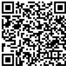
Código QR para validación en sede

Regulación CSV: Decreto 3628/2017 de 20-12-2017